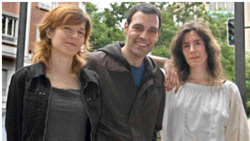
“Todavía hoy es posible mantener un rigor intelectual en las publicaciones”

–Con inteligencia, economía y aguantando. Los primeros años son siempre los más difíciles, y somos conscientes de que tenemos cuatro o cinco años por delante donde tendremos que hacer los que estamos haciendo ahora: malabares es decir ajustar proyectos y presupuestos, no ser rígidos y movernos sin parar para promocionarnos. En el mercado hay muchas cosas positivas como los devoradores de libros y las librerías consolidadas pero también existe la crisis, la competencia, la desaparición de librerías... Elementos que te obligan a estar más alerta porque nosotros queremos lectores, ofrecer